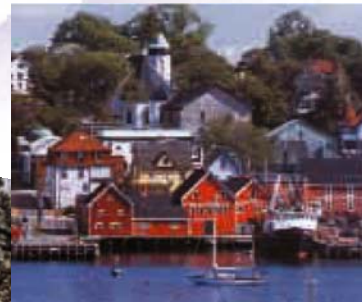
Lunenburg / Miriguèche

La Nouvelle Écosse constitue une pierre angulaire du patrimoine même de notre pays. Une forme "active" de tourisme culturel est la façon idéale de vous la révéler.