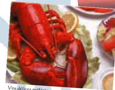
Vos délices préférés...

Note: Novacadie (Services en Tourisme Culturel Acadien) agit en tant qu'intermédiaire dans l'élaboration/coordination de vos expériences voyage, et se dégage de toute responsabilité physique et/ou matérielle des actions des fournisseurs (ex: hôtels, restaurants, compagnies d'autocar, etc.) dont elle n'a pas le contrôle.