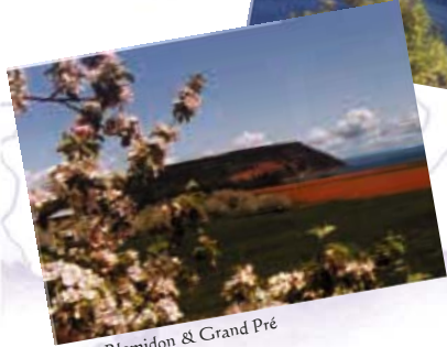
Cap Blomidon & Grand Pré