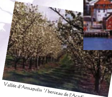
Vallée d'Annapolis / berceau de l'Acadie